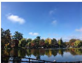
【写真⑥ 常磐公園の美しい自然】