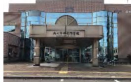
【写真④ 旭川市中央図書館】

みなさん、常磐公園に足を運んだときには、旭川市中央図書館と北海道立旭川美術館に立ち寄ってみてください。