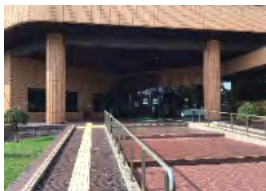
【写真⑤ 北海道立旭川美術館】