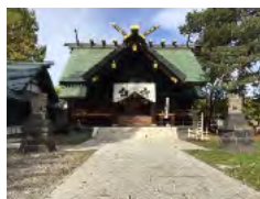
【写真⑦ 上川神社頓宮】

常磐公園にある「上川神社頓宮」は、旭川市民にとって大切な場所なので、私たちも、この神社を大事にしていきたいです。