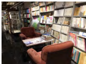
【写真② 旭川文学資料館】