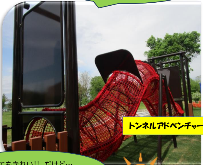
トンネルアドベンチャー