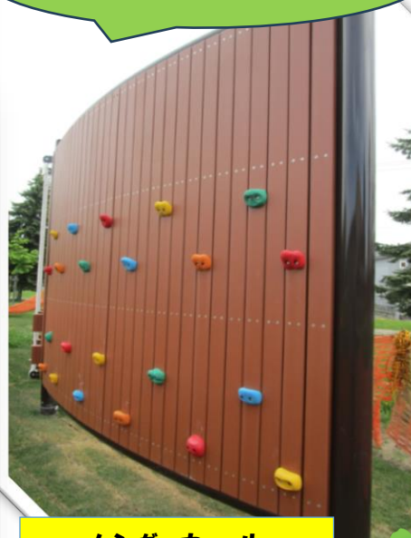
ハンガーウォール