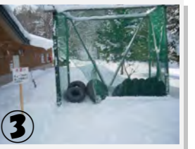
③ この中のチューブを使用。(使い終わったら戻してね!)