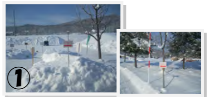
① 駐車場より案内看板を表示。