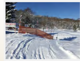
除雪機などで雪入れをし段差をなくす。