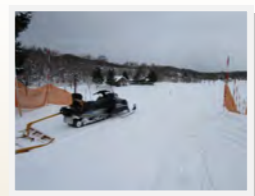
スノーモービルで圧雪作業。